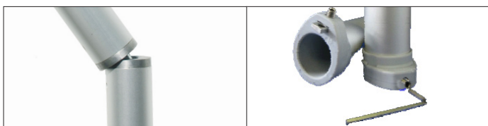
Snodo per ombrellone