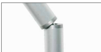
Articulación para sombrillas