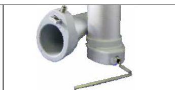
Sistema mod. Scirocco . Para fijación palo con tornillo de cabeza hueca