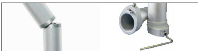
Articulación para sombrillas