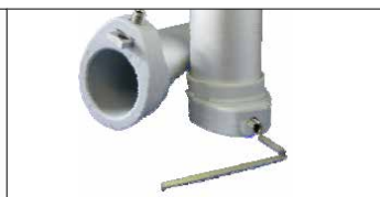
Sistema mod. Scirocco . Para fijación palo con tornillo de cabeza hueca