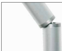
Articulación para sombrillas